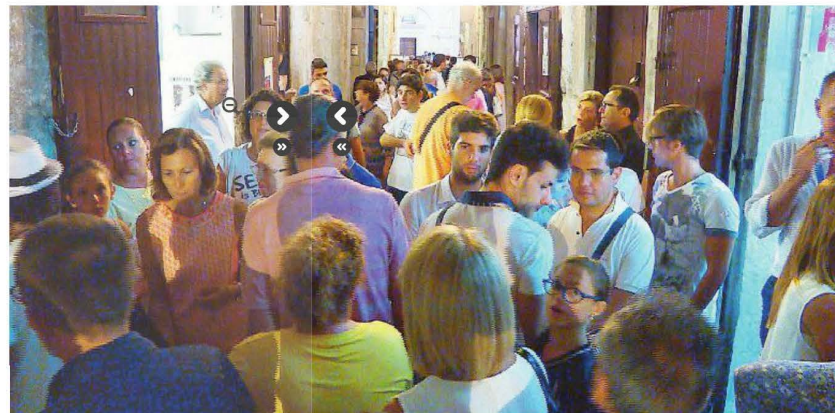
BISCEGLIE Lettori e appassionati di libri alla rassegna nel centro storico

Successo di pubblico, 145 gli autori nelle piazze della città