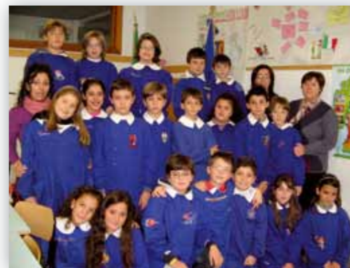
Gli alunni della classe V B