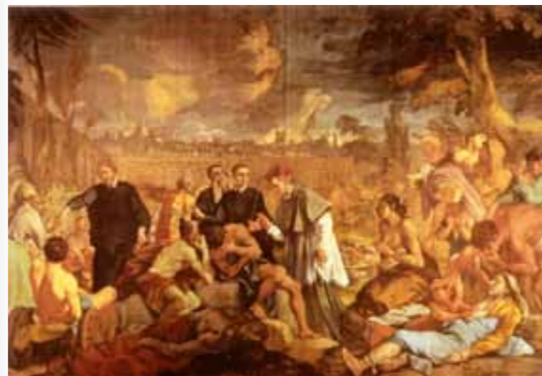
"Voto alla Madonna di Barnaba"