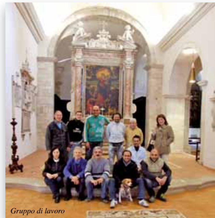
Gruppo di lavoro

La prima fase, ha previsto lo smontaggio delle pavimentazioni esistenti, ed uno scavo stratigrafico che ha consentito di eliminare