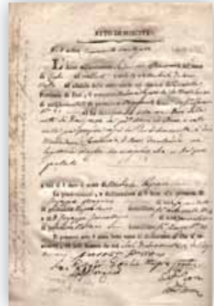
L'atto di nascita di fra Tommaso Passero

Nell'avvicinarsi di così importanti ma soprattutto sconvolgenti cambiamenti, ci si chiede come poté il Vescovo barlettano svolgere tanta attività pastorale e meritarsi la giusta stima popolare nonostante fosse un personaggio e per giunta Vescovo già legato alla dinastia borboni-