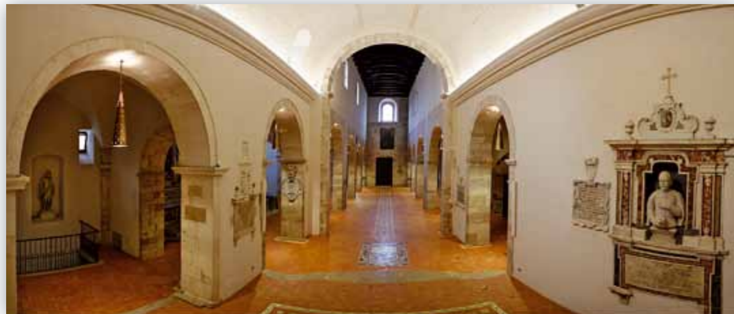
La navata laterale destra, quella centrale e il Presbitero