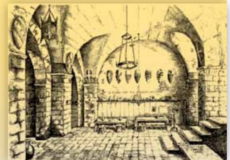
La Cantina della Sfida in un disegno a china del 1984 di Antonio Francesco Giuseppe Pignatelli