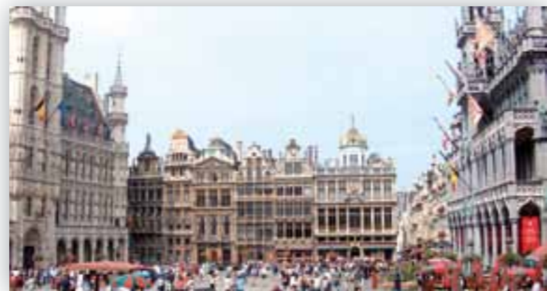
Bruxelles, Grand Place

Il bando, la modulistica per la candidature ed eventuali informazioni sul sito internet http://www.pattionordbareseofantino.it