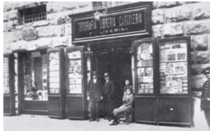
La tipografia-libreria-cartoleria Liverini in una foto del 17 novembre 1907

Caro direttore, sono un barlettano che vive a Roma, sono abbonato al Fieramosca da anni e mi compiaccio per le numerose iniziative culturali che vi si organizzano, specialmente per la pubblicazione dei numerosi libri di autori locali, di poesia e di letteratura, romanzi e saggi storici, almeno uno al mese.