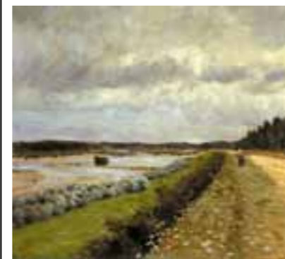
G. De Nittis, Lungo l'Ofanto, 1870

Quest'anno dedicheremo il calendario al nostro grande artista Giuseppe De Nittis e l'iniziativa si chiamerà Barletta sotto i cieli di De Nittis.