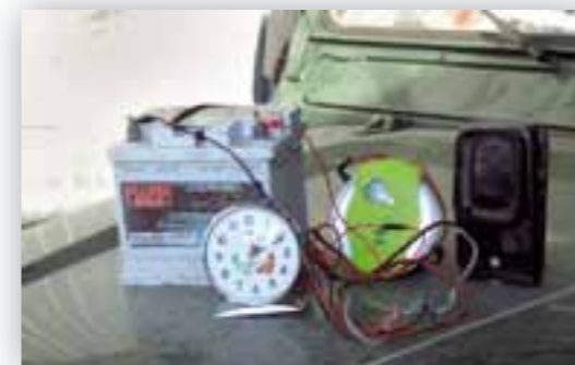
Uno dei Kit sequestrati

Le operazioni, come già detto, si sono svolte di notte ed in particolare nei territori agro-silvo-pastorali dei comuni di Barletta, Andria e Canosa di Puglia, consentendoci di operare il sequestro amministrativo contro ignoti, di ben 11 Kit completi di richiami non consentiti per l'attività venatoria, costituiti da: batterie, registratori, diffusori del suono, timer, cassette e svariati altri accessori.