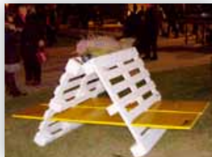
Un'altra opera in concorso, la panchina

Si spera che alla prima edizione del Festival, esperimento positivo, se ne susseguano altre, con l'augurio che l'arte, la musica ed il divertimento servano a sensibilizzare i cittadini della nostra nuova provincia, molto spesso indifferenti alle tematiche ambientali.