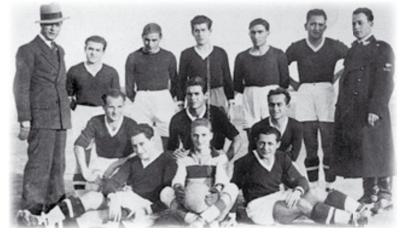
Barletta Calcio, una formazione di quei tempi