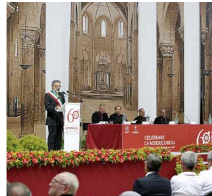
Un momento del messaggio di benvenuto del sindaco di Barletta Nicola Maffei