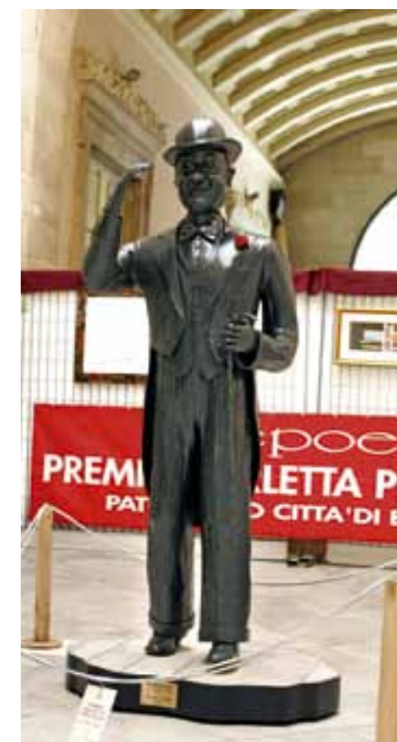
"Piripicchio", statua in ferro realizzata dall'artista barlettano Giuseppe Paolillo

Questa statua/monumento è certamente un'opera che merita attenzione e che va considerata non solo per la sua valenza artistica, ma anche come significativa memoria della nostra storia, della nostra cultura, della nostra tradizione.