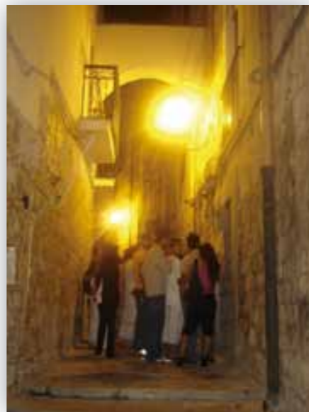
La Stradina dei Poeti in Vico Stretto