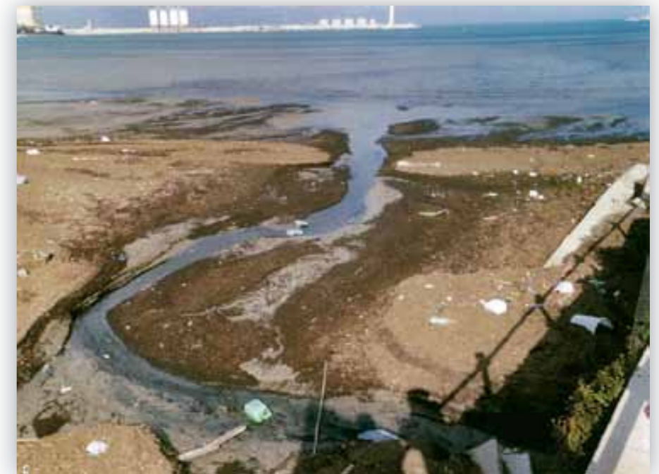
Notare il lontano confine delle acque di colore grigio, espressione di avanzato insabbiamento (cm. 50-60) e lo sversamento dalla radice della spiaggetta di acque di provenienza ignota che formano un rigagnolo (foto del febbraio 2008)

La buona notizia della costruzione nella zona di un porto turistico da parte di una impresa spagnola, risolverà il pro-