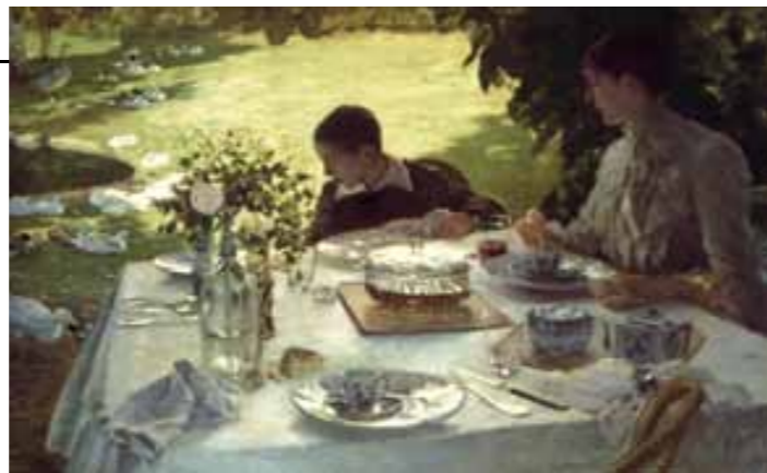
Giuseppe De Nittis, Colazione in giardino, olio su tela

Con lo scorrere degli anni, sulla straordinaria figura del pittore, calò un ingeneroso silenzio. Pochi erano restati a ricordarlo, anche tra gli amici che abitualmente avevano frequentato la sua casa.