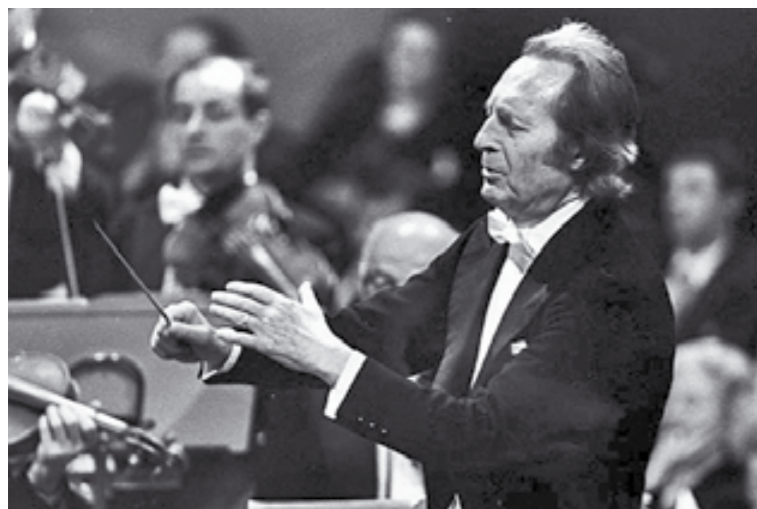
Il maestro Carlo Maria Giulini mentre dirige un concerto