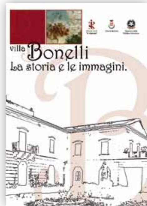
La copertina del libro realizzato dagli alunni del "Garrone"