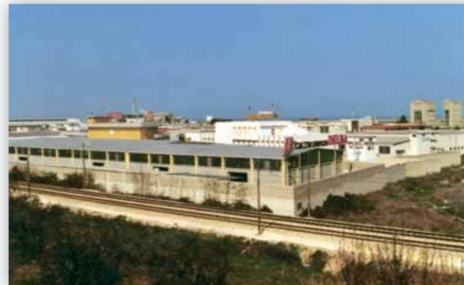
La zona industriale di via Trani