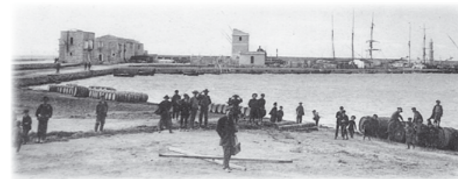
Una vecchia immagine del porto negli anni Cinquanta

In conclusione, pare evidente la benefica azione stimolante de l'ecqua ielt' e l'scitt'm' (schietta, pura) sulla caratterizzazione della genuina barlettanità, a conferma del motto affisso alla locale Lega Navale, proprio al porto: “Il mare rende liberi” - da eccessivi condizionamenti, da paura dell'ignoto, da limiti di spazio e... di tempo!