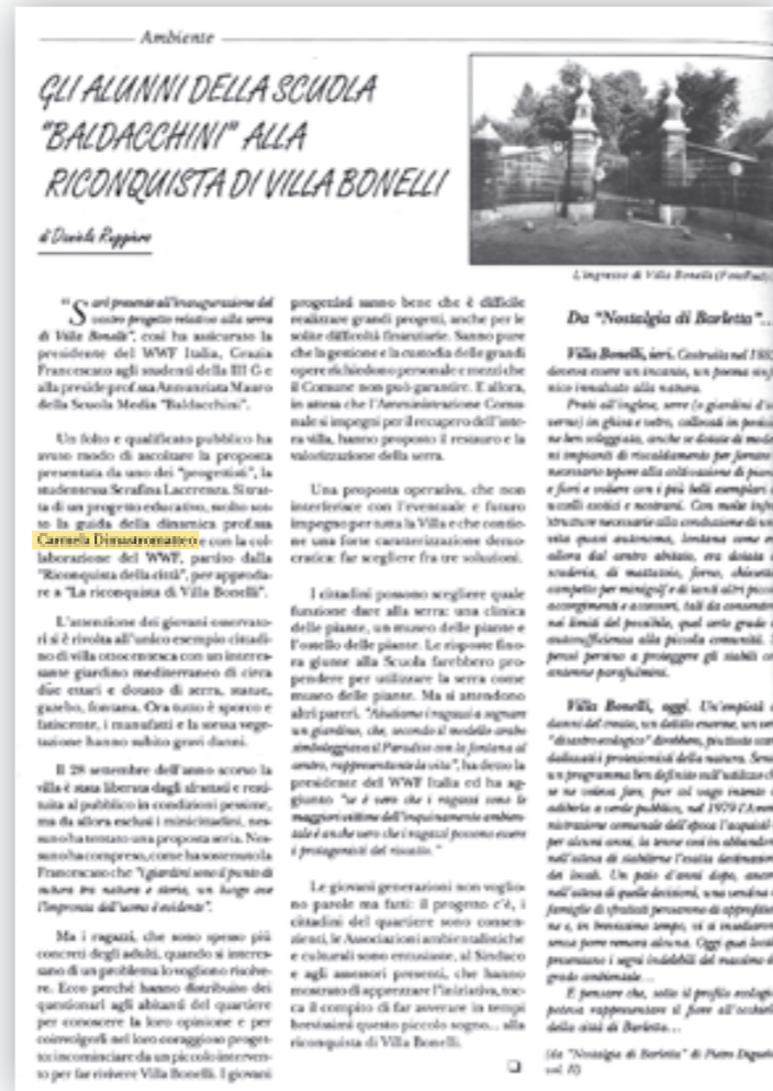
L'articolo della scuola Baldacchini pubblicato sul Fieramosca 2/95, pag. 4, Inserto "Spazio Scuola"

hanno scoperto non solo un giardino, ma un mondo, una metodologia di lavoro di gruppo". L'architetto Nicola Gambarota, presidente della circoscrizione Borgovilla-Tempio, così precisava: "per la prima volta si è concretamente realizzato quel rapporto di sinergia tra il soggetto istituzionale circoscrizione, la scuola, il mondo associativo... si è interrotto l'isolamento e l'indifferenza che da decenni si trascina su Villa Bonelli".