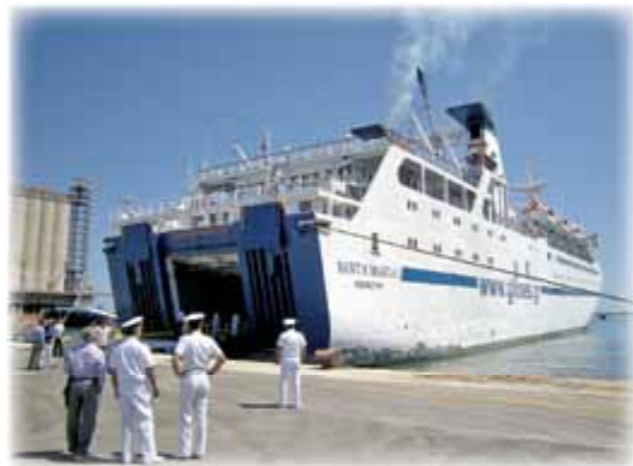
La motonave Santa Maria I

Con il concerto di tutte le forze di polizia e di sicurezza si è riusciti anche a garantire l'efficienza dei controlli ma anche la speditezza degli stessi, come avviene nei porti più abituati al transito di passeggeri in viaggi extra Schengen.