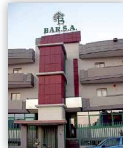
Gli uffici della Bar.S.A.

Tale opzione tuttavia dovrà essere oggetto di ampia discussione e condivisione con gli utenti interessati, pertanto è stata concordata la necessità di avviare incontri tematici con le associazioni di imprenditori presenti sul territorio per giungere rapidamente ad individuare soluzioni percorribili del problema. Fondamentale è inoltre apparso il coinvolgimento delle associazioni in modo che possano fungere da volano per diffondere una cultura che