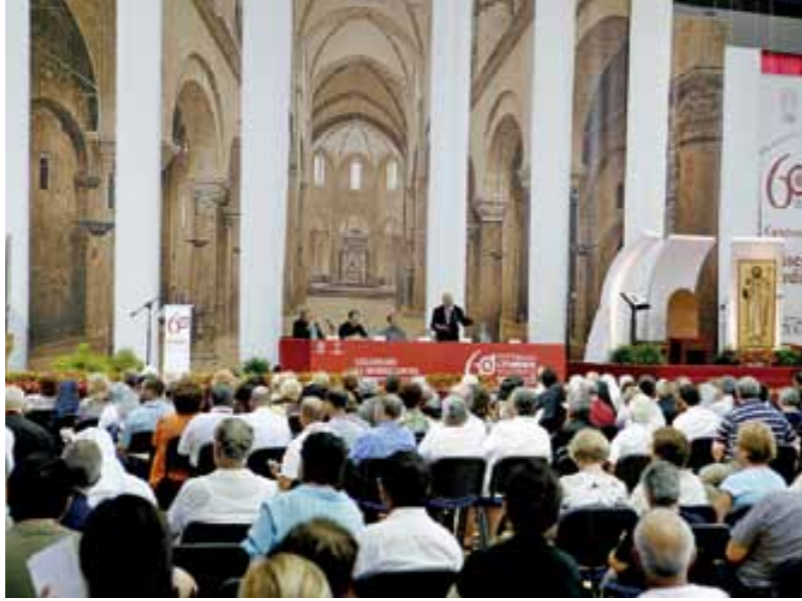
Una panoramica del Paladisfida di Barletta

Dal 24 al 28 agosto 2009 si è svolta nell'Arcidiocesi di Trani-Barletta-Bisceglie e Nazareth, e precisamente nella città di Barletta la 60 a Settimana Liturgica Nazionale. La nostra Arcidiocesi ha bene accolto la scelta fatta dal Consiglio direttivo del CAL (Centro di Azione Liturgica) e dal suo presidente Mons. Felice Di Molfetta, di realizzare l'iniziativa nella nostra terra invece che a L'Aquila colpita dal gravissimo terremoto. Il tema della Settimana "Celebrare la misericordia. Lasciatevi riconciliare con Dio" (2 Cor 5, 20) si interseca con la figura luminosissima di San Nicola il pellegrino, patrono dell'Arcidiocesi. San Nicola con il suo insistente "Kyrie eleison" invitava tutti a "lasciarsi riconciliare con Dio". Figura simbolo di questo appuntamento è la Croce nell'immagine della Stauroteca esposta nella basilica del Santo Sepolcro in Barletta.