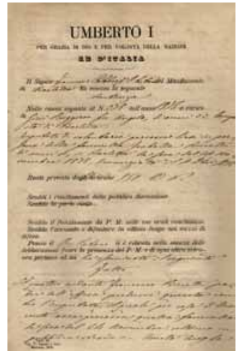
Sentenza di un giudizio penale del 1872