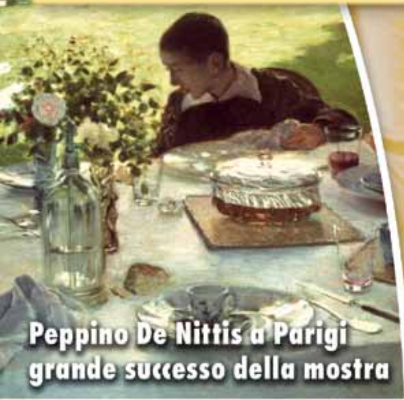
Peppino De Nittis a Parigi grande successo della mostra

Mensile di cultura, informazione e attualità