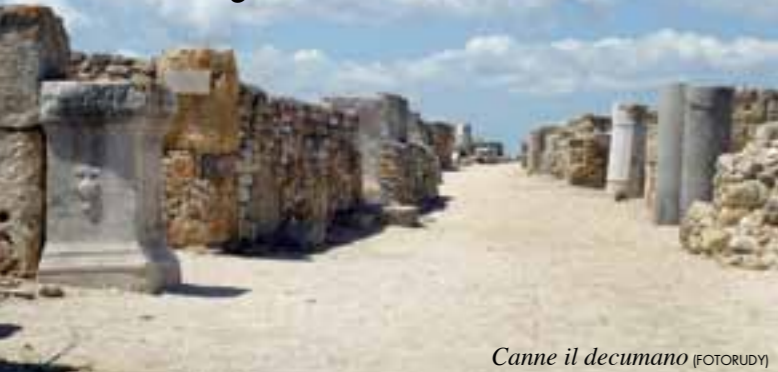
Canne il decumano

glia, fu allestita... una mostra sui gatti che nulla aveva a che vedere non solo con la battaglia, ma neppure con la Canne medievale!! Solo dopo innumerevoli proteste, la mostra fu spostata nella saletta attigua destinata a proiezioni di film tematici, dove ancora oggi fa bella mostra di sé! (ci hanno solo risparmiato l'esposizione in bacheca degli ossicini dei piccoli felini rinvenuti nella circostante campagna).