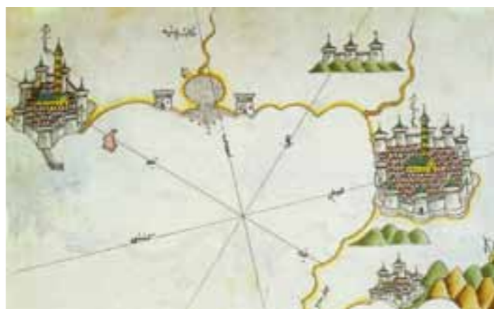
Barletta e a destra la foce dell'Ofanto fra le due torri (dell'Ofanto e Torre di Pietra). Da L'Italia di Piri Re'is la cartografia turca a cura di Antonio Ventura, Capone Editore 1988

Un tarlo si era ormai insinuato nella mia mente, specialmente dopo aver ascoltato i racconti dei pescatori che parlavano di fondali di pietra viva abbastanza pescosi nella zona. Il mare sulla costa ha sempre avuto un andamento altalenante, al punto che ancora ai primi del 1900 lambiva le mura del Paraticchio, come dimostrano le fotografie dell'epoca, probabilmente l'isola, se mai fosse esistita, era scomparsa per due motivi: per bradisismo e a causa dei residui fangosi che provengono di continuo dall'Ofanto. Nel frattempo attingendo ai racconti giovanili, qualche notizia (vera o presunta) cominciai a trapelare, venni così a sapere che il padre di un ex-sindaco, che era stato un palombarista, aveva addirittura scoperto una chiesa con relativo campanile, ma a causa delle attrezzature ingombranti dell'epoca non era riuscito a penetrarvi. Insomma se il fatto si fosse rivelato vero, si sarebbe