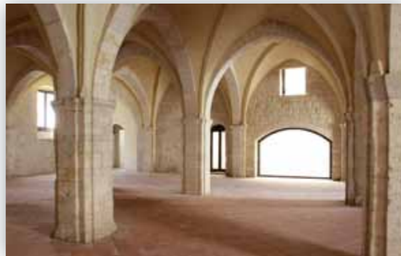
Antico monastero di S. Lazzaro, sala capitolare

Il quadro, infine, veniva completato dall'architetto Giuseppe Teseo della Soprintendenza ai Beni Architettonici e Paesaggistici, direttore dei lavori di completamento della nuova sede, il quale ribadiva che "... la destinazione d'uso dell'ex Convento non poteva essere più appropriata e quindi la sola confacente alla valenza storica dell'edificio" e passando poi ai lavori che saranno effettuati spiegava che "... il progetto prevede un'iniziale attenzione per il piano terra da completare il prima possibile per renderlo fruibile e a disposizione della Città, per proseguire con il piano superiore dove verranno dislocati gli uffici e i depositi".