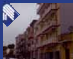
Borgovilla appartamento: salone, cucina abitabile, 2 vani letto, doppi servizi, ripostiglio. Ottime rifiniture. (Rif. BA1610)