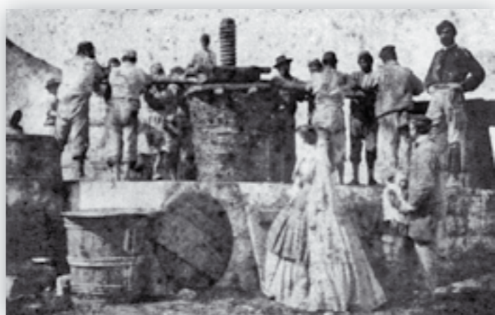
La torchiatura dell'uva al trappeto