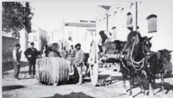
Il travaso in grandi botti, che contenevano fino a 700 litri

(da R. Russo, Barletta nel Novecento , Rotas 2008)