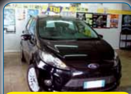
FORD NUOVA FIESTA 1.4 TDCI 70CV TITANIUM CON CERCHI IN LEGA, ANNO NOV. 2009, PREZZO 9.800 TRATTABILI