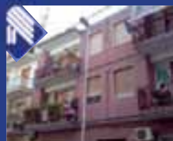
Barberini Via Madonna della Croce appartamento: salone, cucina abitabile, 2 vani letto, studio, bagno. (Rif. BA4110)