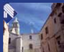
Centro storico vicinanze cattedrale appartamento: soggiorno, angolo cottura, vano letto e bagno. (Rif. BA1810)