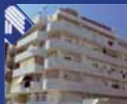
Sette Frati appartamento recente costruzione: soggiorno pranzo, angolo cottura, 2 vani letto, bagno. (Rif. BA2810)