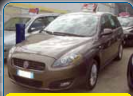
FIAT CROMA SW 1.9 M-JET 16V 150CV DYNAMIQUE CON NAVIGATORE SATELLITARE, CRUISE CONTROL, ANNO 2008, PREZZO 11.800 TRATTABILI