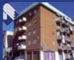
Semicentrale Via Chieffi appartamento: ampio salone, cucina abitabile, 2 vani letto, bagno, ripostiglio. (Rif. BA3310)