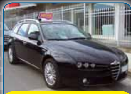
ALFA ROMEO 159 SW 1.9 JTDm 120CV DISTINTIVE, NAVIGATORE SAT., PARK DISTANCE CONTROL, CERCHI IN LEGA, CAMBIO AUTOMATICO, ANNO 2008, PREZZO 11.800 TRATTABILI