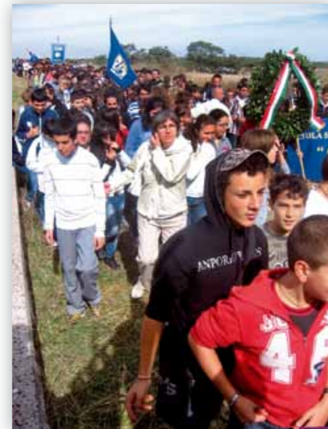
Scolaresche in visita a Murgetta Rossi

È stata una giornata davvero commovente, ricca di emo-