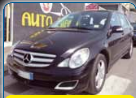
MERCEDES CLASSE R R-CLASS 320 CDI V6 SPORT LUNGA CON CAMBIO AUTOMATICO, CLIMA BIZONA, INTERNI IN PELLE, GANCIO TRAINO, ANNO 2006, TRATTATIVA RISERVATA