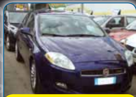
FIAT BRAVO 1.9 M-JET DINAMIQUE 120CV, ANNO 2007, PREZZO 8.700 TRATTABILI