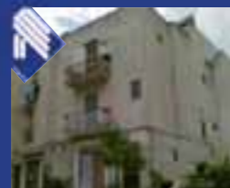
Semicentrale vicinanze P.zza Plebiscito appartamento: cucina abitabile, 2 vani letto, bagno, ripostiglio, Balconi. (Rif. BA2210)