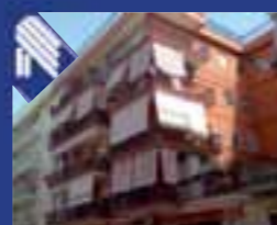
Barberini appartamento ristrutturato composto da: salone, tinello e cucinino, 3 vani letto, bagno, Veranda. (Rif. BA4410)