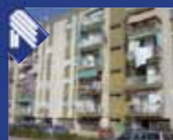
Patalini appartamento: salone, cucina, 3 vani letto, doppi servizi e ripostiglio. Cantina. Posto auto. (Rif. BA5609)