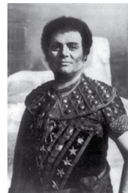
È "Radames" nell' Aida (Milano, 1973)