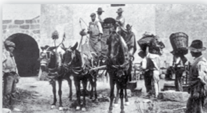
L'uva raccolta scaricata direttamente sul carro