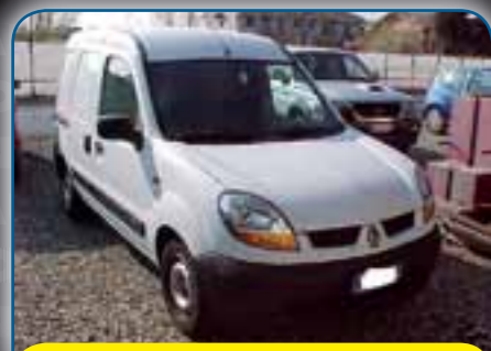
RENAULT KANGOO 1.5 DCI 68CV GRAND CONFORT, ANNO 2006, PREZZO 5.000 TRATTABILI