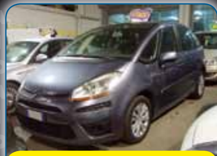
CITROEN C4 PICASSO 1.6 HDI 110CV FAP CON CAMBIO AUTOMATICO, ANNO 2007, PREZZO 12.600 TRATTABILI