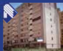
167 via P. Ricci appartamento: soggiorno, cucinino, 3 vani letto, doppi servizi e lavanderia. Box auto. (Rif. BA4210)