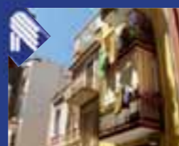
Sette Frati appartamento: cucina abitabile, 2 vani letto, doppi servizi, Veranda. (Rif. BA3309)

RSM Real Estate Solution Mutual Mutui e Finanziamenti Mutuo fino all'80% seconda casa fino al 100% per la prima casa 0883.333861