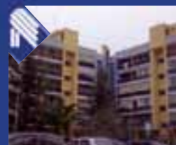
Parco degli Ulivi appartamento: soggiorno pranzo, cucinino, 2 vani letto, bagno. Ottime condizioni. Box. (Rif. BA1710)