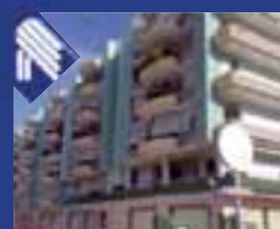
Sette Frati Appartamento recente costruzione: salone, cucinino, 4 vani letto, bagno e ripostiglio. Box auto. (Rif. BA610)