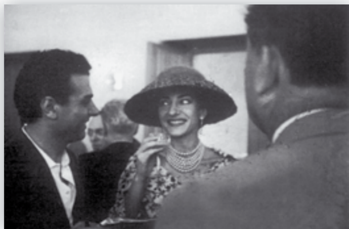
A sinistra, il tenore con Maria Callas (Bruxelles, 1958)