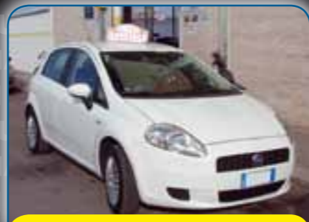
FIAT GRANDE PUNTO 1.3 M-JET 90CV DYNAMIQUE, VARI COLORI, ANNO 2007, PREZZO 6.700 TRATTABILI