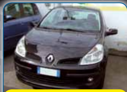
RENAULT CLIO 1.5 DCI 85CV DYNAMIQUE, ANNO 2006, DISPONIBILE ANCHE BENZINA, PREZZO 7.200 TRATTABILI