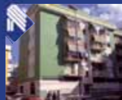
Barberini traversa Via Madonna della Croce appartamento: soggiorno, tinello, cucinino, 2 vani letto, bagno. (Rif. BA3010)