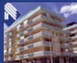
Parco degli Ulivi appartamento recente: sala, cucinino, 2 vani letto, bagno, ripostiglio, Ottime rifiniture. (Rif. BA2610)