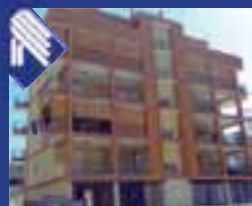
Sette Frati recentissima costruzione: salone, soggiorno, angolo cottura, 3 vani letto, bagno, Box auto. (Rif. BA2910)

Agenzia di Barletta 0883.333861 Via Ferdinando d'Aragona, 217