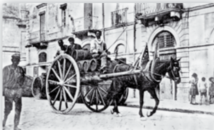
Una mandegna che ha appena caricato