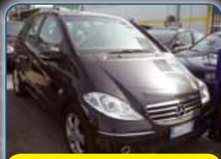
MERCEDES CLASSE A 200 SPORT 140CV, ANNO 2006, PREZZO 13.800 TRATTABILI