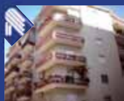
Centrale Via D'Aragona appartamento: salone, cucina abitabile, 4 vani letto, doppi servizi e ripostiglio. (Rif. BA4010)