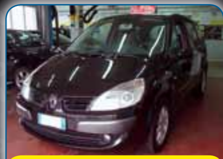
RENAULT SCENIC 1.9 DCI 130CV DYNAMIQUE, ANNO 2006-2007, PREZZO 9.000 TRATTABILI