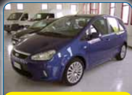
FORD NEW C-MAX 1.8 TDCI 115CV TITANIUM, ANNO 2007, PREZZO 11.300 TRATTABILI