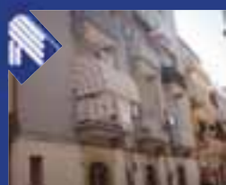
Barberini traversa via Barberini appartamento: soggiorno pranzo, angolo cottura, 2 vani letto, bagno. (Rif. BA3210)