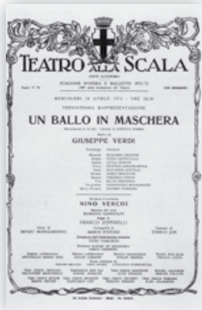
Locandina di Un ballo in maschera (1973)