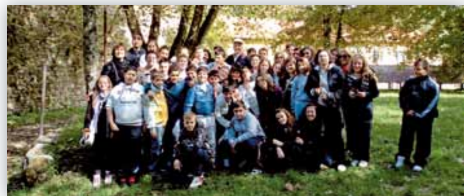
Gli alunni e i docenti della "R. Moro" vincitori del concorso "Un albero per i nipoti"