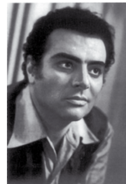
Orofino è "Turiddu" al debutto di Cesena in Cavalleria (1963)

A Ruvo conobbe Michele Bernocco che lo presentò al maestro Michele Cantatore che gli insegnò la prima romanza d'opera, "Oh paradiso", dall' Africana di Mayerbeer. L'incoraggiamento ricevuto dal noto maestro, rappresentò una forte spinta a determinarlo nella scelta della sua carriera artistica.