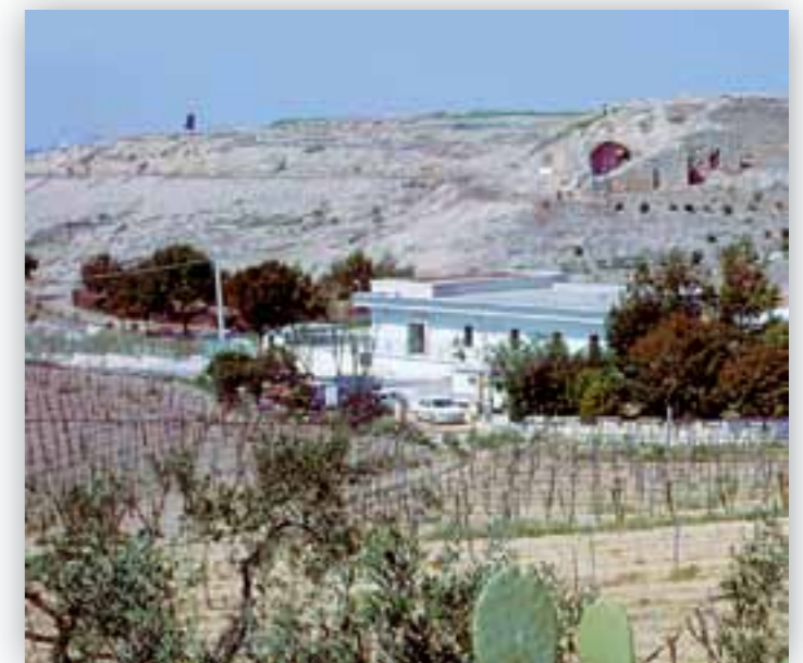
L'Antiquarium di Canne

Quando, nel 2002, il Touring Club Italiano pubblicò la guida L'Italia antica (con l'elenco di 500 località e la descrizione di 281 aree archeologiche) ci affrettammo a comperare il volume di cui erano state stampate 60.000 copie, distribuite in tutte le stazioni turistiche nazionali, per accorgerci amaramente che il volume non conteneva alcun cenno al sito di Canne. Telefonammo allora alla redazione del Touring e dopo numerosi infruttuosi tentativi, la curatrice del volume finalmente ci rispose, precisando che le notizie sui siti archeologici provenivano direttamente dalle Soprintendenze regionali, attraverso loro pubblicazioni e che per quanto riguardava la Puglia, la graduatoria delle sue presenze era stata ricavata dalle sue monografie, fra cui una recente incentrata sulla Terza settimana per la cultura: 26 febbraio-4 marzo 2001 , nella quale erano det-